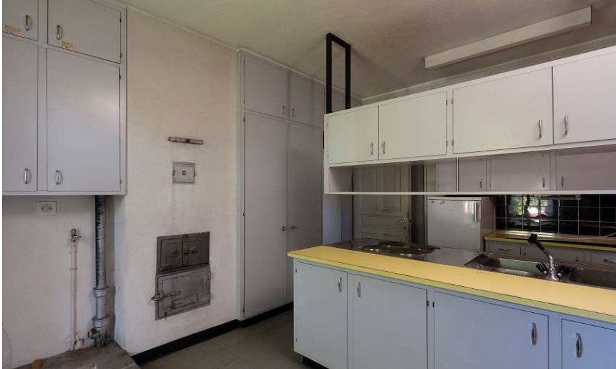
Bilder (dkp-zh; uf; vvf-w)