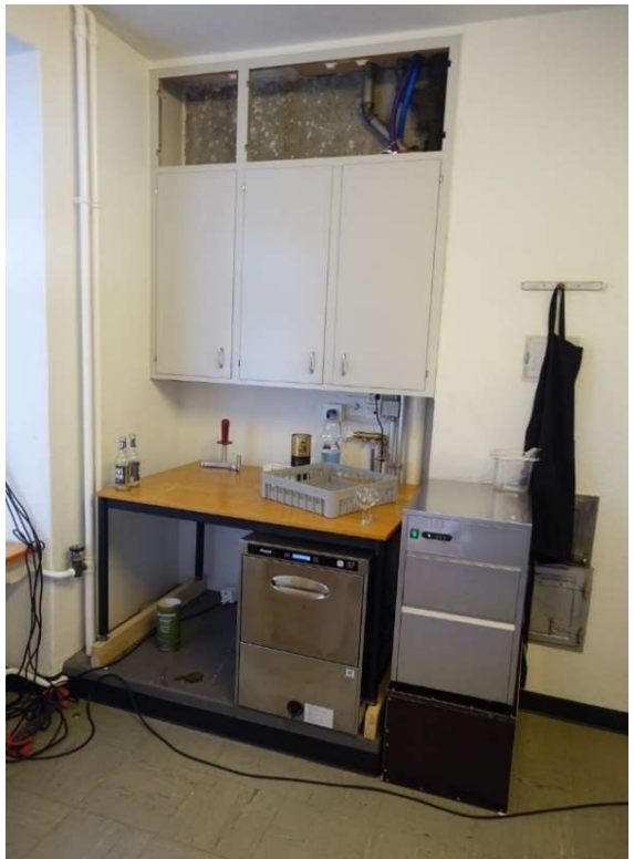
Gläserabwasch- und Eismaschine