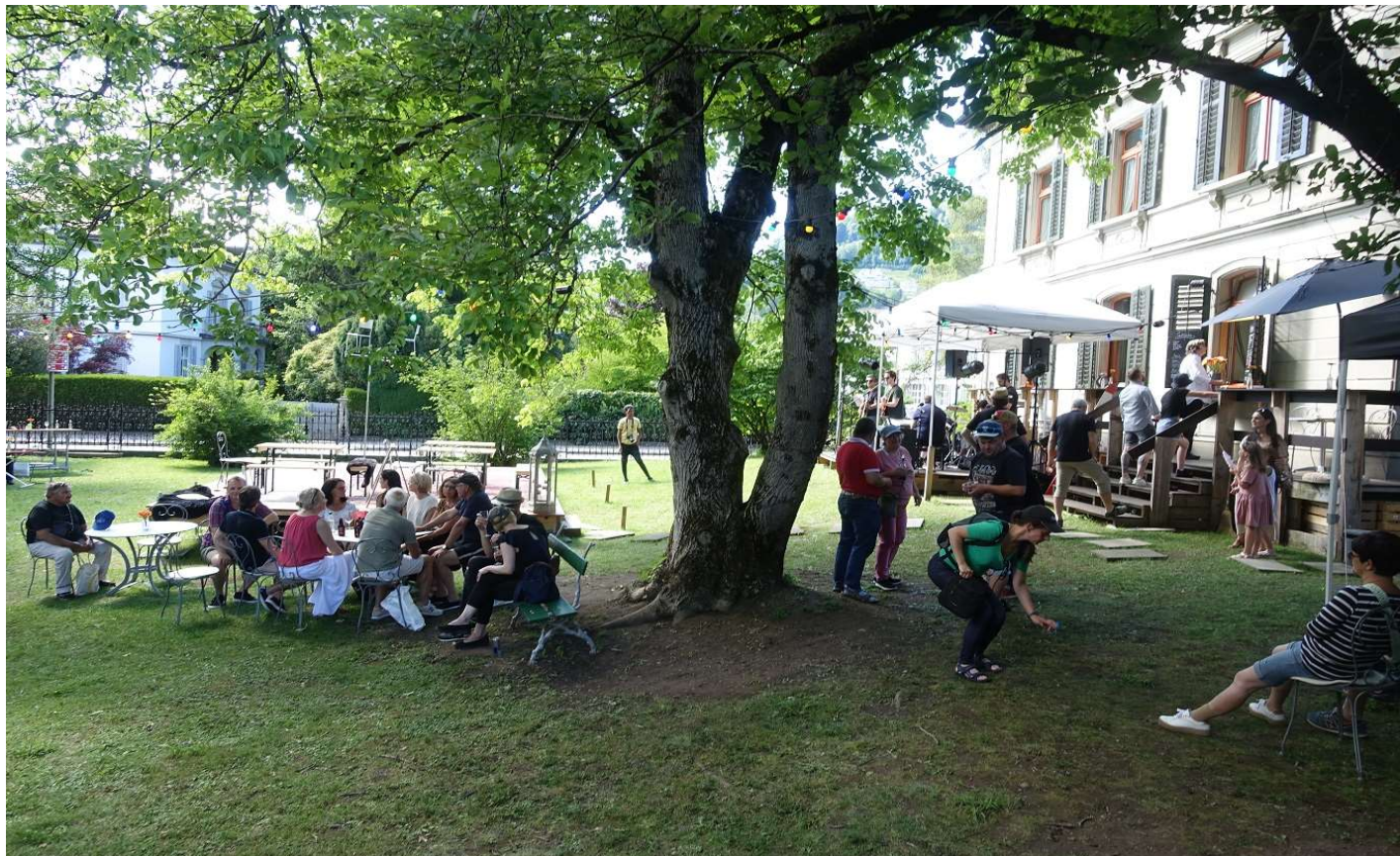
Bistro-Zugang vom Park auf der rechten Bildhälfte

Im Park hat es mehrere Holz- und Gasgrills zum warm kochen