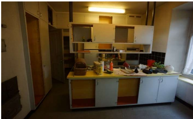
Restauratorische Instandsstellung der bestehende Küche von 1961