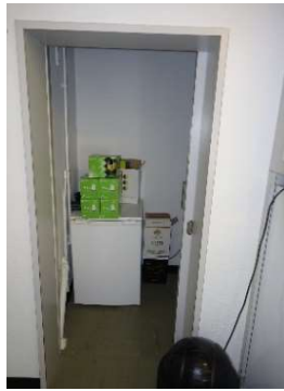
Reduit für Vorräte