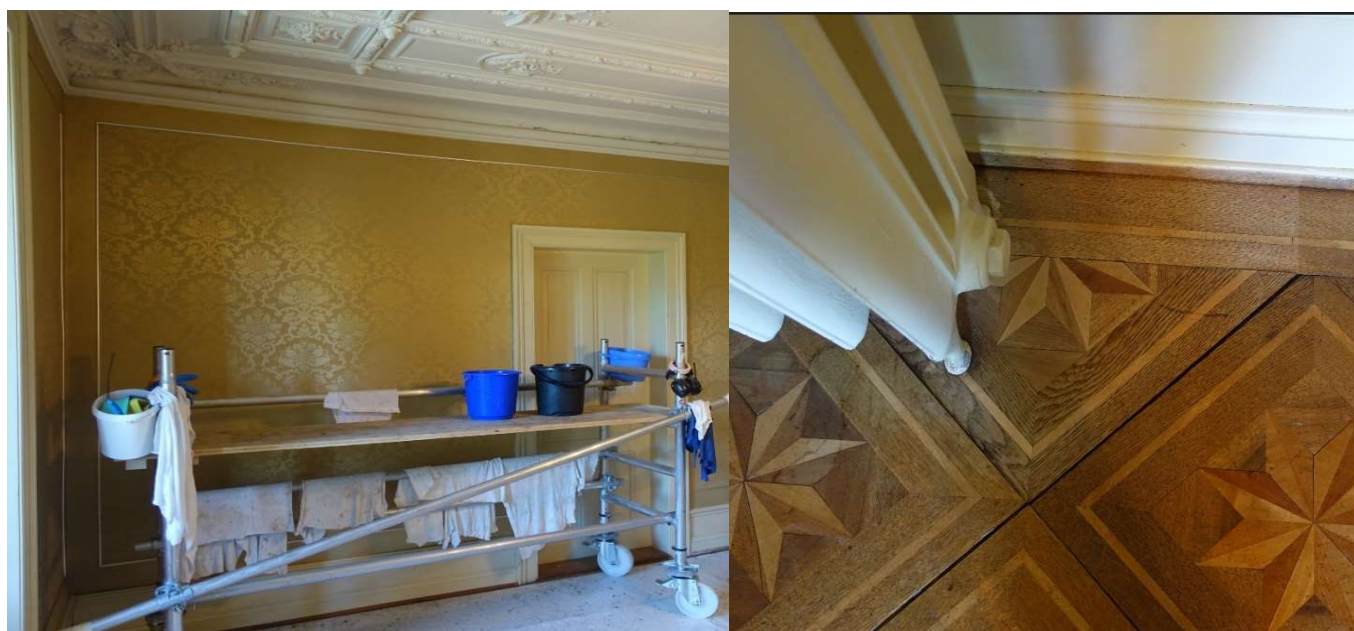
Restauratorische Reinigungsarbeiten an Decken, Wände und Parkett